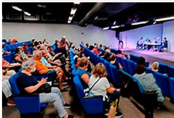
Presencial: AAPS realizou assembleia presencial no auditório Joseph Safra, na Vila Clementino.