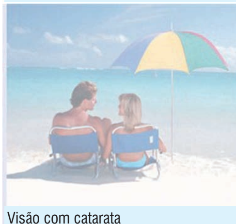
Visão com catarata